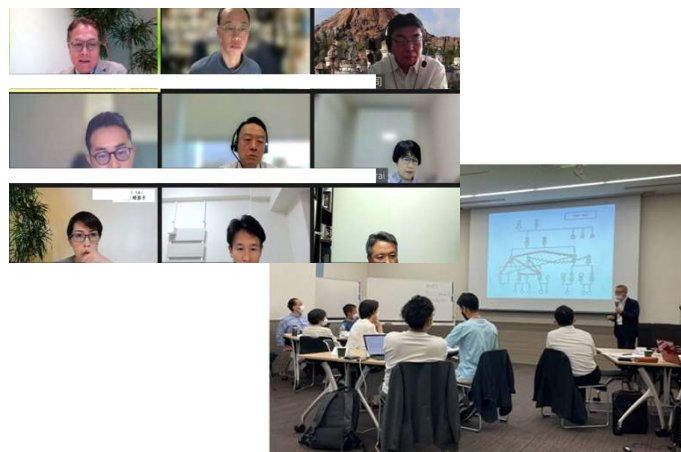
リアルとオンラインを併用したスクーリング