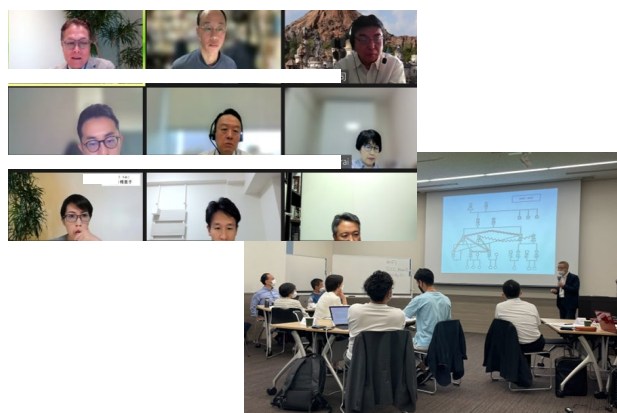
リアルとオンラインを併用したスクーリング